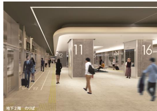
ターミナル内(イメージ)